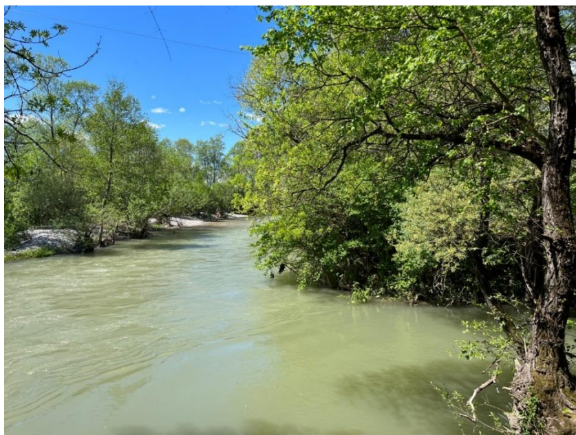
Slika 1. Ušće reka Llap i Sitnica u selu Lumardh

Nedavno je odluka MSV-a br. KNMU/K/03/2018 od 07.12.2018 da se pocne sa ovim procesom. Nedavno je zajednica donatora takođe zatražila da se ovaj proces završi (izveštaji progressa EU za Kosovo kontinuirano zahtevaju funkcionalizaciju URS i takva obaveza je uključena u sporazum između Vlade Kosova i Vlade Švajcarske za program IMVR-K . Međutim, treća institucija za koju se očekivalo da će biti osnovana po Zakonu o Vodama, Institut za Vode Kosova, nije pokrenuta, a njeno osnivanje se ne smatra važnim zbog nedostatka stručnog okvira.