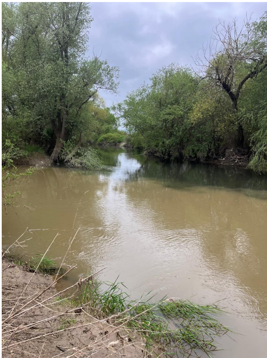
Figura 1. Bashkimi i lumenjëve Llapi dhe Sitnica në fshatin Lumadh