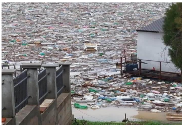
Foto 3. Liqeni i Ujmanit gjatë vërshimeve 2023 (kontribut qytetar)

rajonale të ujit për pastrimin e tyre periodik. Figura dy më poshtë ofron një ilustrim të këtyre sistemeve të thjeshta për t'u ndërtuar dhe përdorur për parandalimin e mbeturinave detare.