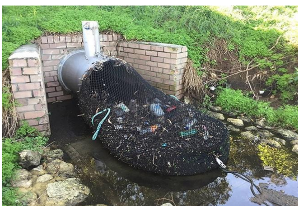
Foto 4. Rrjeti i dreanzhimit, Australi