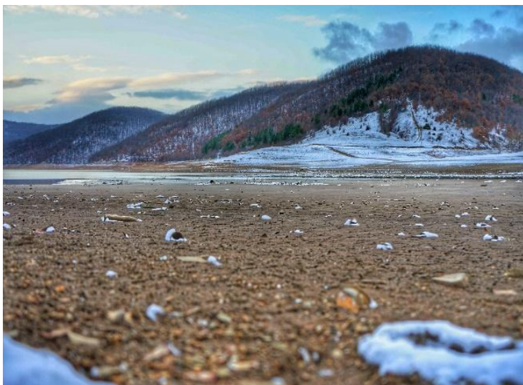
Foto 1. Liqeni i Badovcit gjatë thatësirave

Duke pasur parasysh se efektet e ndryshimeve klimatike pritet të përkeqësohen me kalimin e kohës dhe manifestimi i tyre përmes rritjes ekstreme të ngjarjeve të motit si në frekuencë ashtu edhe në intensitet, është mundësia e fundit që institucionet e Kosovës të rrisin përpjekjet për të siguruar siguri ujore afatgjate. Sipas një prej informatorëve kryesorë, disa skenarë për ndryshimet klimatike, parashikojnë ulje të disponueshmërisë së ujit me 20% deri në 2040-2050 11 .